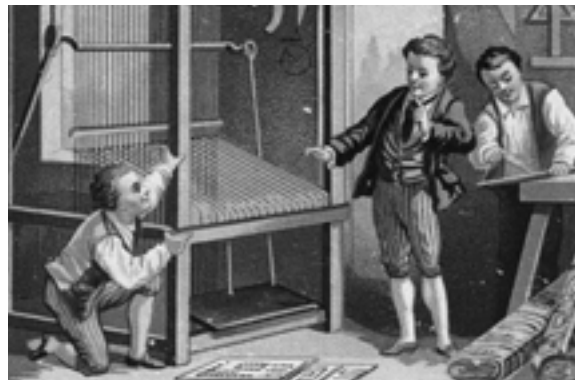
Avec son métier à tisser piloté par cartes perforées, Jacquard crée la première machine à programme externe (ou logiciel).

ou bien on loge du côté de Heidegger — qui considère que l'on passe à côté de l'essence de la technique si l'on accepte a priori sa neutralité —, ou bien on appartient au clan adverse : toute technique est bonne en soi et porteuse de promesses émancipatrices, tout dépend de l'usage que l'on en fait — comme si l'on pouvait faire autre chose que la guerre avec des chars d'assaut. Aussi caricatural que puisse paraître ce clivage — qui reproduit sensiblement la vieille dialectique de la diabolisation et de la divinisation des techniques, laquelle occupe une place de choix dans les imaginaires occidentaux —, il n'en demeure pas moins qu'il correspond au climat de polarisation extrême qui domine la sphère des techno-sciences dans la société québécoise.